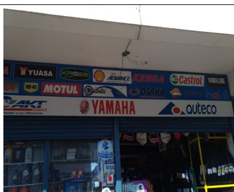
Foto 2. Vista general de la Publicidad Exterior Visual