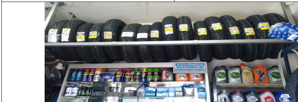
Foto 3. Vista general del acopio de llantas